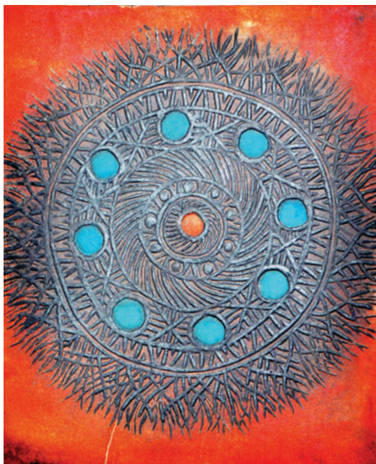
ROZETTE II 1970. linogravura, papir

U likovnoj ostavštini Josipa Resteka zanimljivost predstavljaju figurativni radovi iz pedesetih godina. Sadržajno su vezani uz ljudski lik, pojedinačne dječje figure ili skupine djece prikazane u igri. Formalno gledajući riječ je o kompozicijama intenzivnog kolorita, oblicima