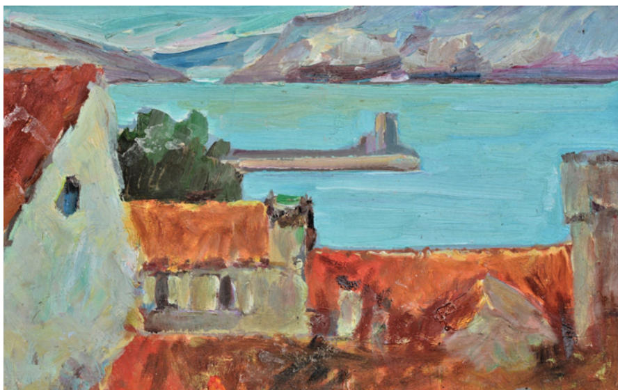
BEZ NAZIVA, Pogled iz atelijera, oko 1970., ulje, drvo